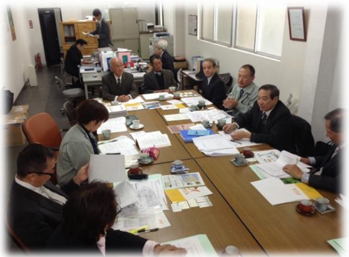
諫早市栄町東西街区再開発組合 との意見交換