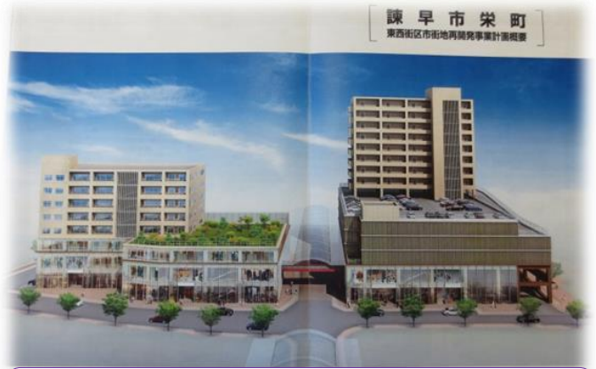
諫早市栄町東西街区再開発ビル予定図 左側街区は4階建てに変更される。