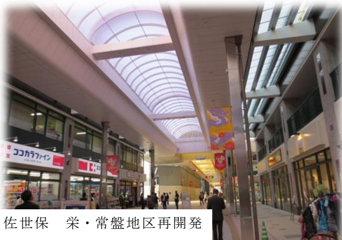
佐世保 栄・常盤地区再開発

平成 25 年 12 月 3 日（火）4 日（水）の両日、理事を中心とした有志 8 名が長崎県内における再開発取り組みの現状を学ぶべく、佐世保、諫早に視察を行いました。