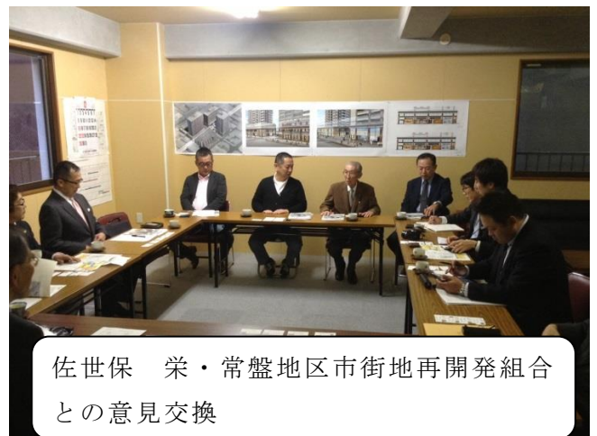
佐世保 栄・常盤地区市街地再開発組合との意見交換

佐世保駅みなと口には、先月 29 日“させぼ 5 番街”がオープンし、地元スーパーを